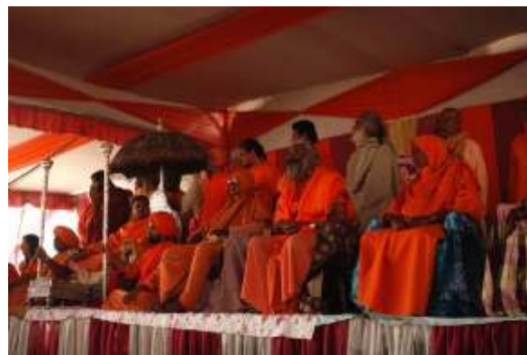
Vista parcial de la plana de Pontífices participantes, con la Madre en la extrema izquierda de la imagen

Cuando hablábamos un día en Rishikesh, sobre algo formal de su tarea, ella me dijo: “¿Tú piensas en eso? Yo pienso todo el tiempo en Dios”.