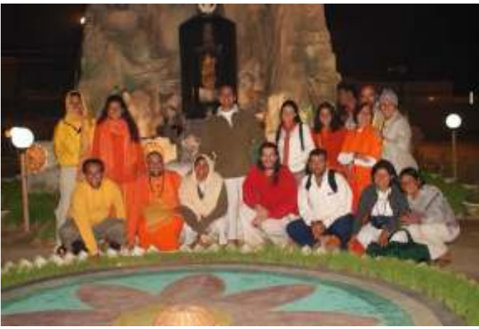
La Madre con parte del grupo de discípulos que le acompañó durante la peregrinación