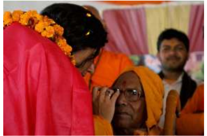
Shakti Ma coloca el tilak al legendario Swami Lakhsanand, quien la bendijo en su nombramiento.