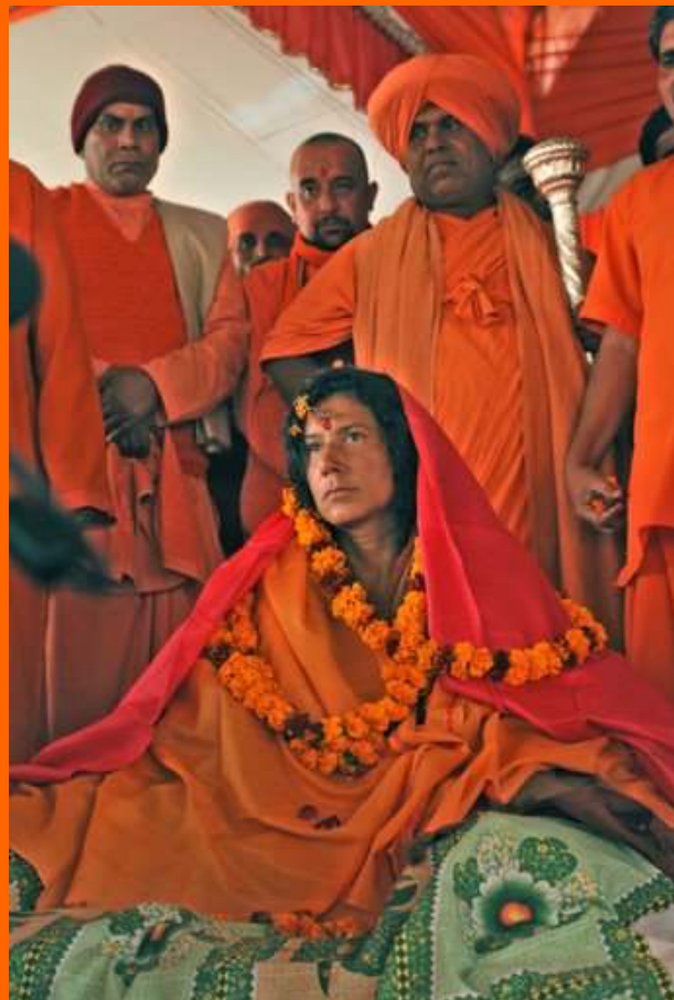
La Madre fue consagrada como Mahamandaleshwar en una inolvidable Ceremonia

No se trata de mirar para creer, y todavía en estas alturas ni de sentir para creer, son pocos los que han avanzado hacia la Verdad profunda, y es mejor aceptarlo, confiar, sobre todo cuando a través de nosotros mismos queda manifiesto lo que hemos sido.