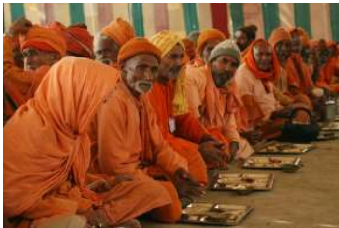
Sadhus (Santos) reciben Vandaram, ofrenda de alimento para todos los monjes y participantes

O cuando decenas de personas en el Festival Internacional de Yoga pedían tiempo para conversar con ella, o solicitaban Iniciarse en su Enseñanza, ella decía – Bueno, les escribimos, yo creo que es tiempo de volver a casa-