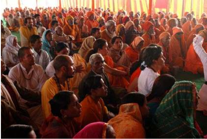
Imagen de los asistentes a la Ceremonia de nombramiento