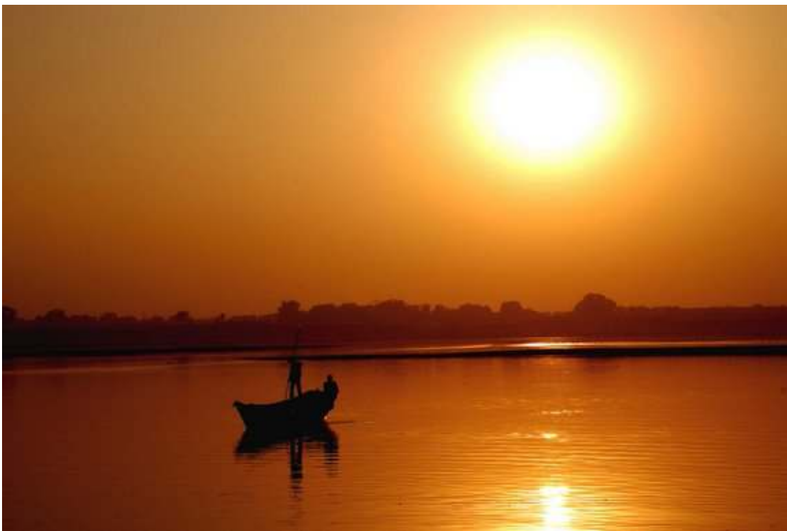
Amanece en el Sangam, el Sagrado lugar de encuentro de los ríos Ganges y Yamuna. Kumba Mela, Allahabad 2007