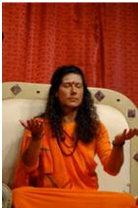
La Madre emanando su Luz en el Darshan de Caracas